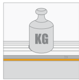
Kortstondige belasting(CS) \geq 55 kPa