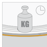
Langdurige belasting (CC) \geq 450 kPa