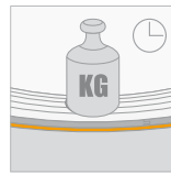
Langdurige belasting (CC) \geq 450 kPa