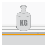
Kortstondige belasting (CS) \geq 55 kPa