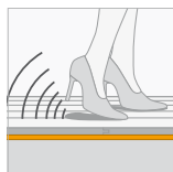
Reflectiegeluid (RWS) 6 %