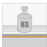
Drukweerstand (CS) ≥ 10 kPa