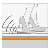
Reflectiegeluid (RWS) 4 %