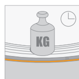
Kruipweerstand (CC) 2 kPa