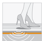
Contactgeluidisolatie (IS) 19 dB ΔLw