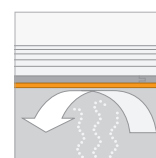
SD Waarde (SD) ≥ 200 meter